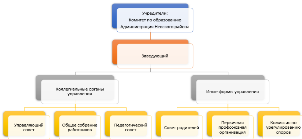
Рисунок 1. Система управления ГБДОУ

Органы управления, действующие в Образовательной организации на основании Устава Государственного бюджетного дошкольного образовательного учреждения детского сада № 71 Невского района Санкт-Петербурга: