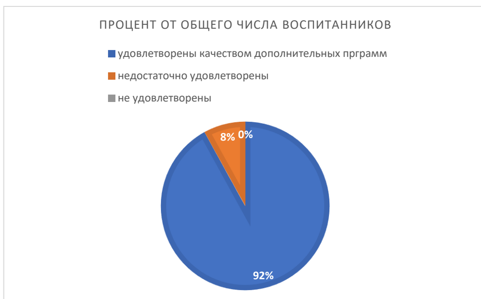
Рисунок 7. Анкетирование родителей по удовлетворенности дополнительными услугами

Процесс внутренней системы оценки качества образования регулируется внутренними локальными актами, проводится в соответствии с годовым планированием с использованием качественного методического обеспечения. Данные, полученные в результате контрольно-оценочных мероприятий, отражаются в отчете о результатах самообследования и других отчетных документах. Эти данные рассматриваются на Общем собрании работников, Педагогическом совете, рабочих совещаниях для анализа эффективности деятельности и определения перспектив развития учреждения. На основании проведенного анализа разрабатываются мероприятия по повышению качества образовательного процесса, корректируются образовательные программы и планы работы педагогов. Особое внимание уделяется внедрению современных педагогических технологий и методов обучения, направленных на развитие личностных качеств воспитанников и повышение уровня их образовательных достижений.