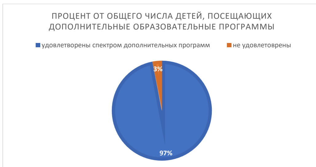
Рисунок 3. Результаты анкетирования родителей (законных представителей) по уровню удовлетворенности качеством дополнительного образования

В декабре 2025 года анкетирование родителей воспитанников показало высокий уровень удовлетворенности дополнительным образованием. 3 % опрошенных выказали неудовлетворенность платными услугами, предложив проводить больше открытых занятий и перенести их проведение на первую половину дня.