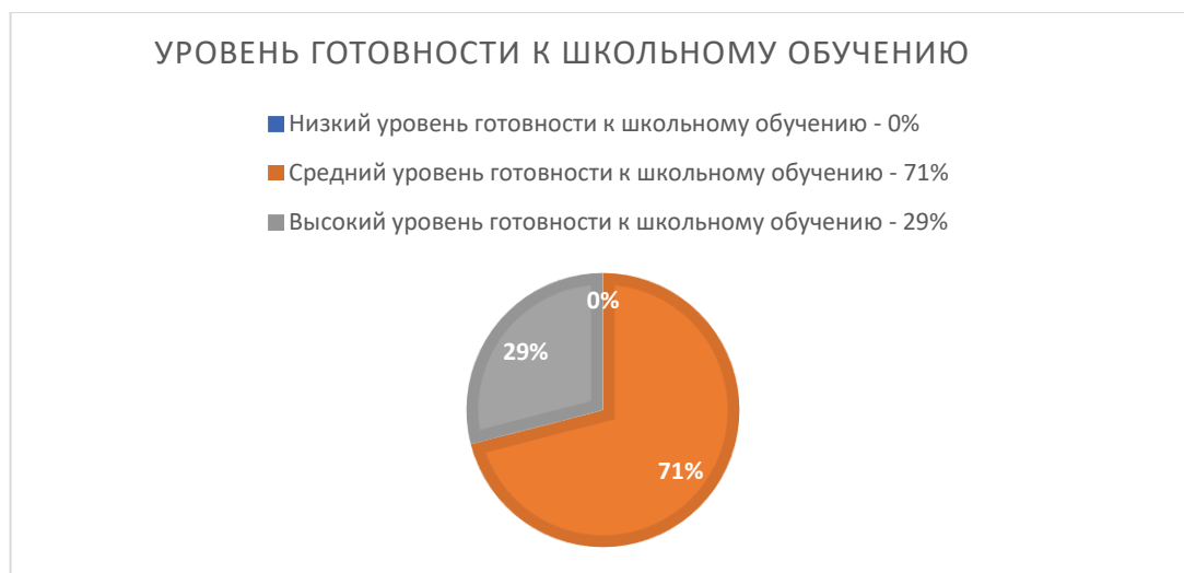
Рисунок 5. Готовность к школьному обучению воспитанников подготовительных групп (%)

Результаты обследования: высокий уровень готовности к обучению в школе выявлен у 58% воспитанников, средний уровень выявлен у 42% воспитанников, низкий уровень готовности не выявлен. Таким образом, все выпускники 100% готовы к школьному обучению.