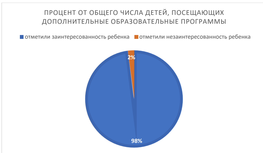
Рисунок 8. Анкетирование родителей по заинтересованности представленными дополнительными программами

Выводы: в ГБДОУ создана функциональная, соответствующая законодательным и нормативным требованиям внутренняя система оценки качества, позволяющая своевременно корректировать различные направления деятельности учреждения. Система обеспечивает комплексный подход к оценке результатов работы педагогов, воспитателей и административных сотрудников, способствуя повышению эффективности образовательного процесса и улучшению качества предоставляемых услуг. Она также позволяет выявлять ключевые проблемные зоны и разрабатывать меры по их устранению, что способствует непрерывному совершенствованию работы учреждения.